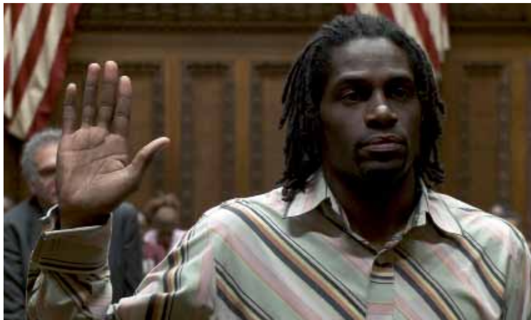
Cleveland contre Wall Street de Jean-Stéphane Bron (2010)