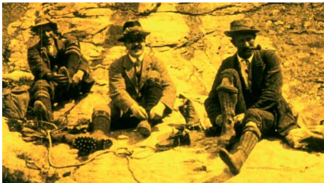
Switzerland off the Beaten Track