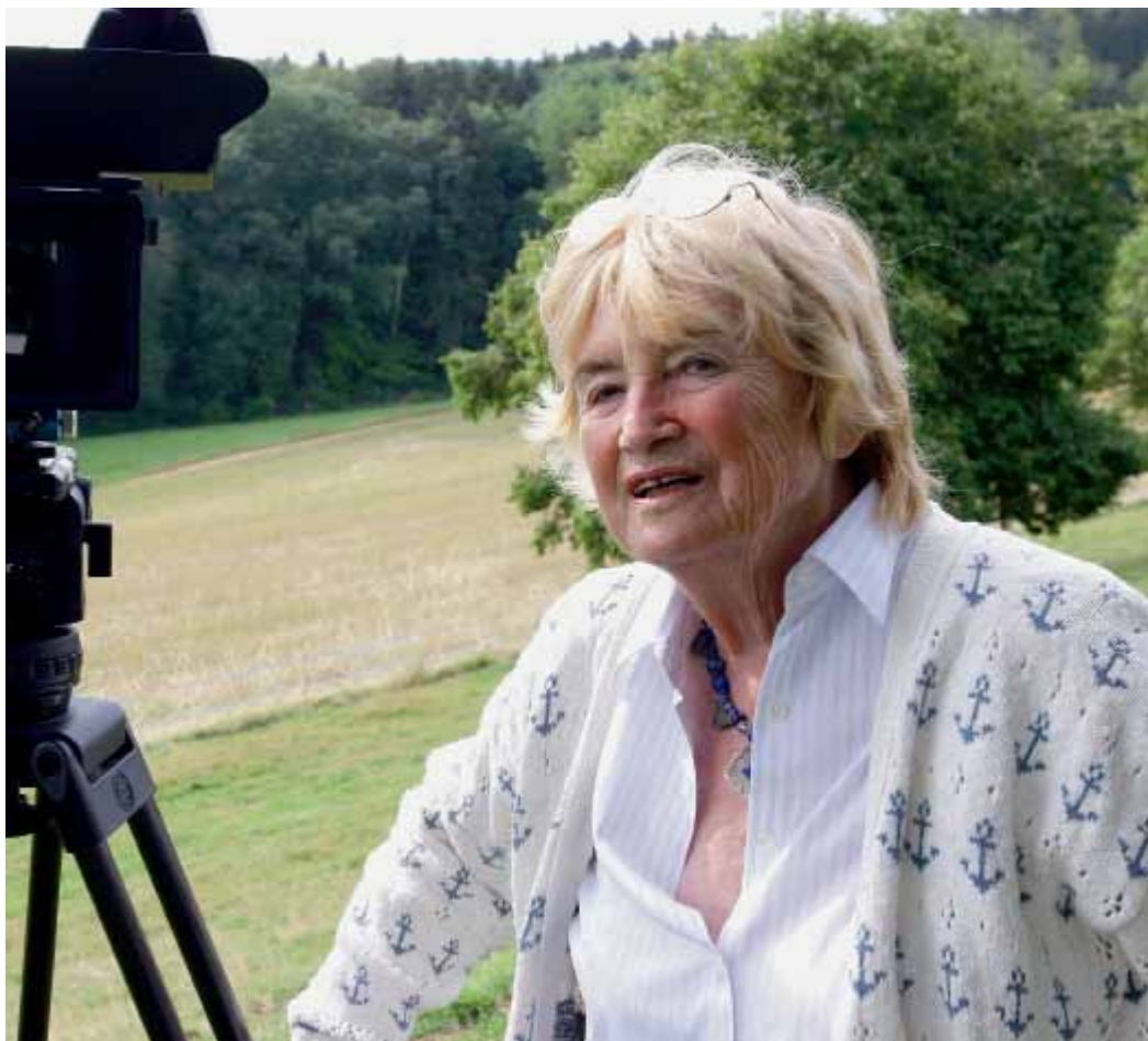
Jacqueline Veuve sur le tournage de C'était hier (2010)