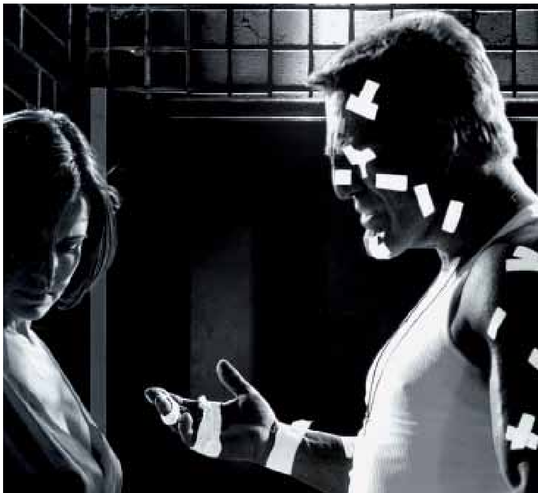
Carla Gugino et Mickey Rourke dans Sin City de Frank Miller et Robert Rodriguez (2005)